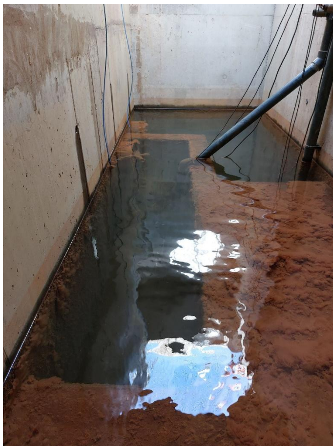
Vu des fosses du regard de pompage