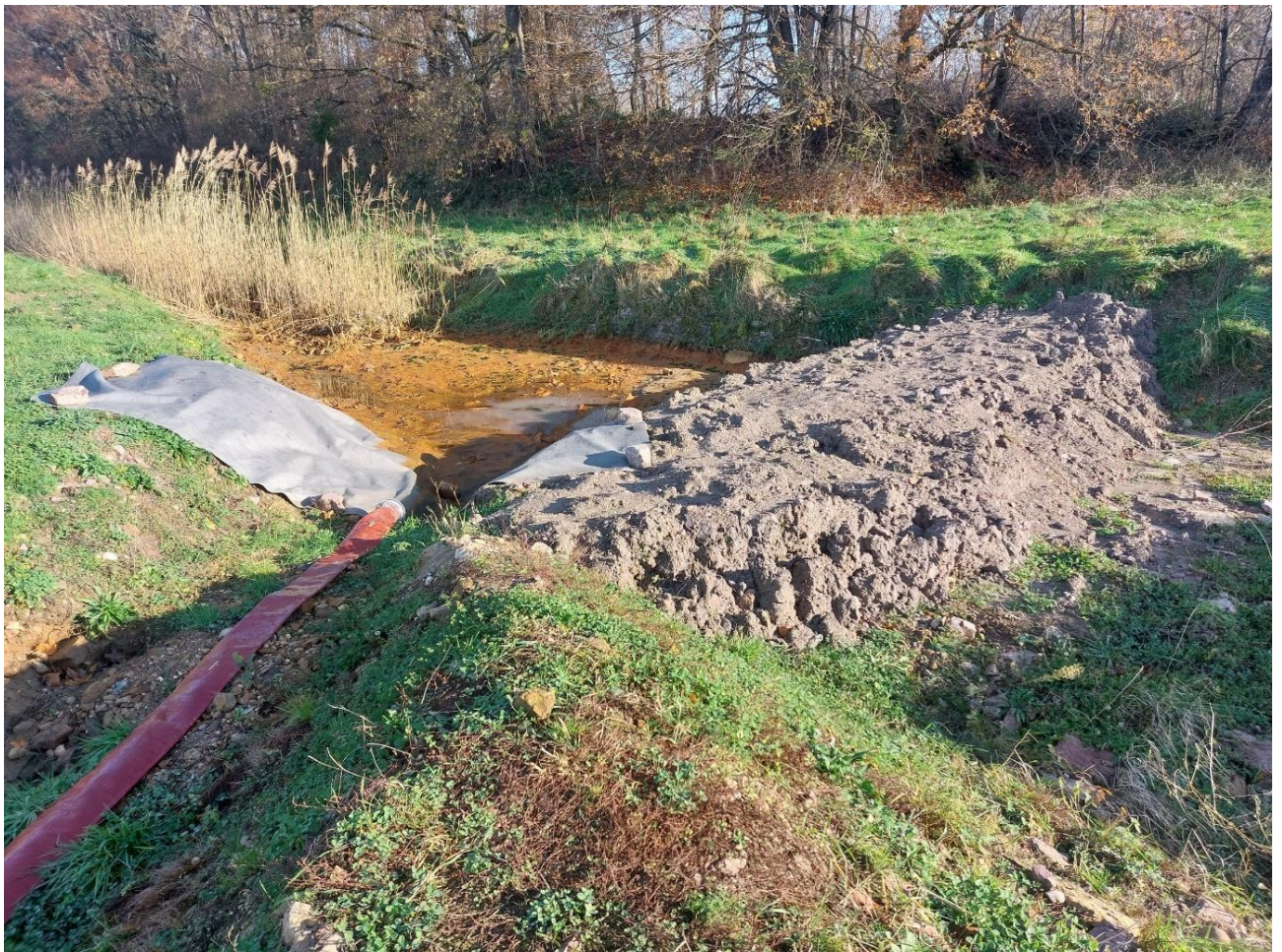
Batardeau en terre à l'aval des enrochements