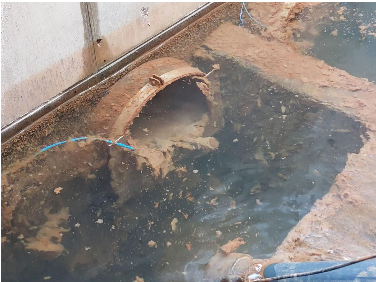
Vu des exutoire DN500 avec seuil calibré