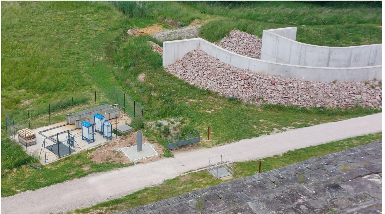
Vu depuis la crête du bassin de dissipation et du regard R0-R1 (zone de travaux)