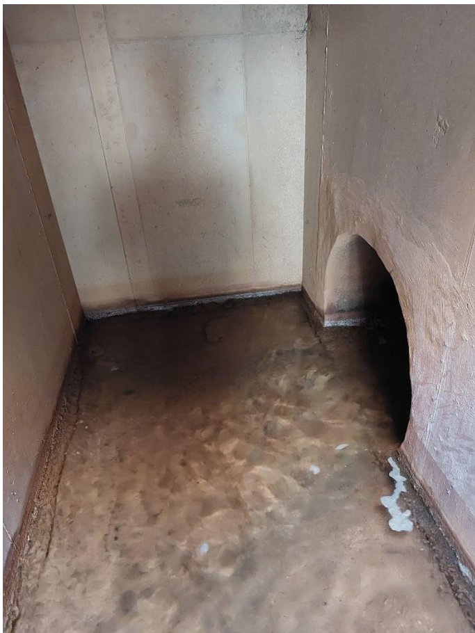
Vu de l'arrivée du DN600/DN800 dans le regard de pompage