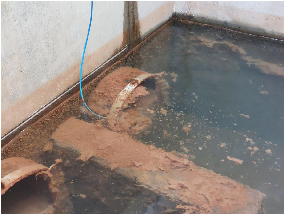
Vu des exutoire DN500 avec seuil calibré